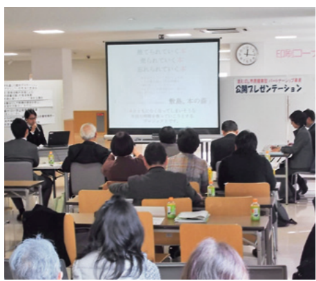
提案のプレゼンテーションを公開

日時 2月27日(土)午前10時～午後4時 会場 前橋プラザ元気21内501・502学習室 [印] 当日会場へ直接 [印] 生活課 ☎027-898-510