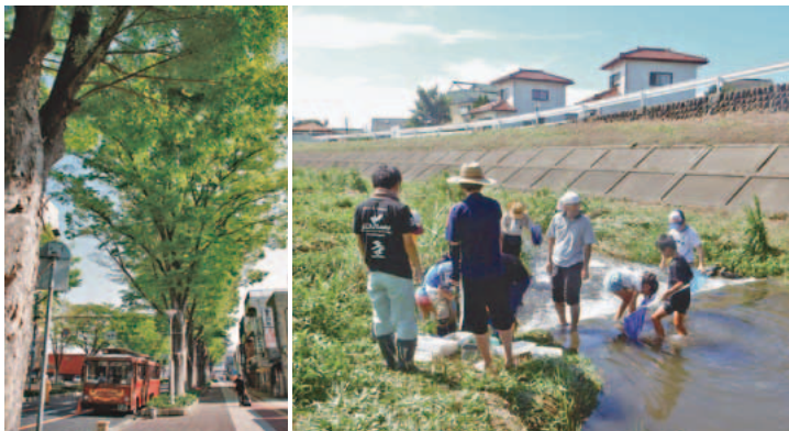
(左) 水と緑と詩のまち・前橋。豊かな自然環境は私たち前橋市民の宝 (右) 赤城白川の水質を検査する子どもエコクラブ。南橋地区ではごみ減量やリサイクル活動だけでなく、子どもたちへの環境教育にも熱心だ

持続可能な循環型社会では、私たち一人一人のライフスタイルを、環境負荷の小さいものにするのが重要です。市民・事業者・行政が一体で取り組み、平成26年度のごみの総排出量は平成21年度に比べて5・7割減少。資源ごみの量は、平成24年度から紙のステーション収集を開始したこともあり、5・9割増加し、リサイクルが進みました。