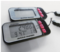
1日の歩数と早歩き時間を測定