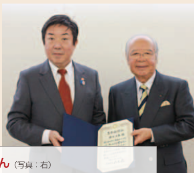
猪谷 千春さん (写真：右) 日本人初の冬季五輪メダリスト、国際オリンピック委員会 (IOC) 名誉委員ほか