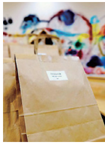
意外な本との出会いを楽しんで

自分では選ぶことのない本と出会える本の福袋、「〇〇袋」を開催します。テーマと対象年齢に沿った本を図書館のスタッフが選び、3冊と5冊のセットに。そのセットを袋に入れ、中身がわからない状態で貸し出します。期間=3月24日(木)から全て貸し出しになるまで