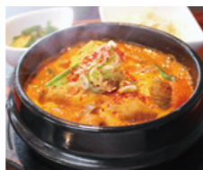
きむち屋 もちゅ煮