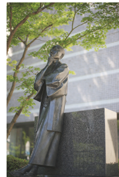
PROFILE SAKUMI HAGIWARA

内容=詩人・萩原朔太郎が撮影した写真と同じ場所を、孫で映像作家の萩原朔美新館長が同じ構図で撮影した写真を展示