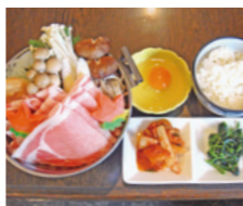
焼肉乃上州 敷島店 上州麦豚すき焼き膳