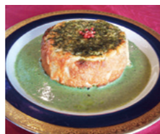
シェ・スナガ グリーンドーム