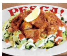
PIZZERIA PESCA! 麦豚スパイシー オーバーライス