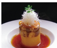
椿家本店 やわらか麦豚大根