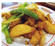
中華そば ほんこん ほんこんで食べたい 咖喱肉

入賞店・料理=中華そば ほんこん「ほんこんで食べたい咖喱肉」、PIZZERIA PESCA!「麦豚スパイシーオーバーライス」、椿家本店「やわらか麦豚大根」、きむち屋「もちゅ煮」、シェ・スナガ「グリーンドーム」、焼肉乃上州 敷島店「上州麦豚すき焼き膳」