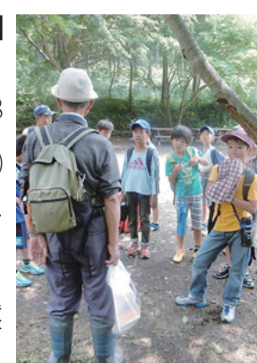
自然から学ぶ子どもたち

助成条件や申請方法など詳しくは問い合わせください。 補助金額は工事費用の2分の1(上限10万円) 水道整備課 ☎027-898-3037 まえばしネットは登録確認を 適正な個人情報の管理のため、まえばしネット登録情報の確認が必要になりました。平成26年8月31日までに利用者登録し、今後も利用を希望する人は、4月30日(土)までに次の施設で手続きをしてください。 受け付け施設はヤマト市民体育館前橋、宮城体育館、大渡温泉水プール、前橋総合運動公園、大胡総合運動公園 スポーツ課 ☎027-898-5832 環境保全活動を支援します 市内の団体が市民を対象に実施する、地域での自然観察会や小中学生向けの環境保全活動などに補助金を交付します。交付は1団体1事業までです。 補助金額は経費の3分の2(上限10万円) 申込書の配布は市役所環境政策課で。本市ホームページからダウンロードもできます