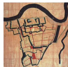
前橋藩酒井家前橋城絵図