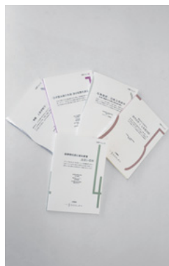
前橋を学ぶきっかけに

テーマ・日時 ① 二之宮式三 番叟 5月26日(木) ② 剣聖・上泉伊勢守 6月2日(木) ③ 台湾