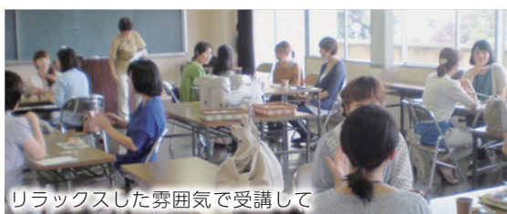
リラックスした雰囲気を受講して