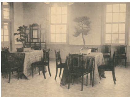
内装もモダンな館内