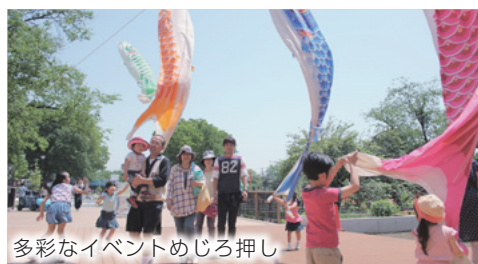
多彩なイベントめじる押し