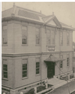
初代の図書館館舎