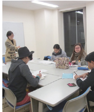
日本語を基礎から学べます

日時Ⅱ（教室授業）①5月11日 ②5月12日 ③5月7日 ④5月11日 ⑤5月12日 ⑥5月13日 ⑦5月14日 ⑧5月15日 ⑨5月16日 ⑩5月17日 ⑪5月18日 ⑫5月19日 ⑬5月20日 ⑭5月21日 ⑮5月22日 ⑯5月23日 ⑰5月24日 ⑱5月25日 ⑲5月26日 ⑳5月27日 ㉑5月28日 ㉒5月29日 ㉓5月30日 ㉔5月31日 ㉕6月1日 ㉖6月2日 ㉗6月3日 ㉘6月4日 ㉙6月5日 ㉚6月6日 ㉛6月7日 ㉜6月8日 ㉝6月9日 ㉞6月10日 ㉟6月11日 ㊱6月12日 ㊲6月13日 ㊳6月14日 ㊴6月15日 ㊵6月16日 ㊶6月17日 ㊷6月18日 ㊸6月19日 ㊹6月20日 ㊺6月21日 ㊻6月22日 ㊼6月23日 ㊽6月24日 ㊾6月25日 ㊿6月26日