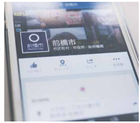
フェイスブックで情報を発信しよう

スマートフォンを使ってフェイスブックで情報発信を行う、初級・中級者向けの講座を開催。まえばし地域活動ポイント制度 対象事業です。日時 5月20日(金)・30日(月)、午後6時30分～8時