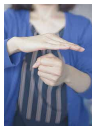
通訳などで活動して