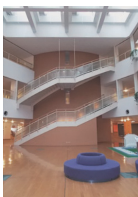
施設の利用予約を受け付け

総合福祉会館と第四コミュニティセンターの10月から12月までの施設利用予約受付会を開催。