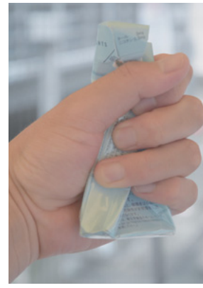
禁煙にチャレンジしよう