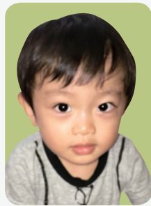
ゆう ゆいちゃん 片倉 優ちゃん 端気町