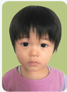
そら あきちゃん 並木 蒼昊ちゃん 徳丸町