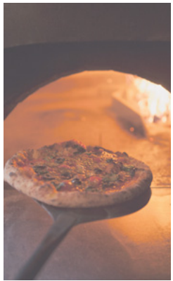
ピザは石釜で焼きます

「県都前橋のイタリア物語」日帰りバスツアーを開催。友好都市のイタリア・オルビエート市にちなみ、イタリア野菜の収穫体験やイタリア人講師とのトークを楽しみながら手作りピザの試食も。昼食も付きます。 日時 12月1日(木)午前9時30分〜午後3時 集合場所 JR前橋駅南口(表町二丁目)