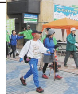
スズラン前橋店新館北側に

前橋市民健康クラブウォーキングステーション(千代田町二丁目)が開館します。定期的に街中ウォーキングを行い、活動量計を活用した健康測定などを実施。日常生活で活動量計に蓄積されたデータから、専門家が健康維持をアドバイスします。 12月18日(日)午後2時から、オープニングセレモニーとウォーキング会を開催。当日同館へ直接お越しください。 開館日時=火木土日曜、午前10時~午後5時 費用=入会金2,000円、年会費3,000円(いずれも当分は無料)