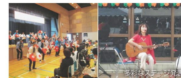
多彩なステージ発表

自然食材の調理などをとおして、生活や環境を考えるオーガニックカレッジを開催します。日時は2月23日から3月16日までの木曜4回、午後7時から9時までで、前橋プラザ元気21で行います。18歳から30歳まで、先着30人が対象。費用は2,000円です。2月16日(休)までに生涯学習課へ申し込んでください。