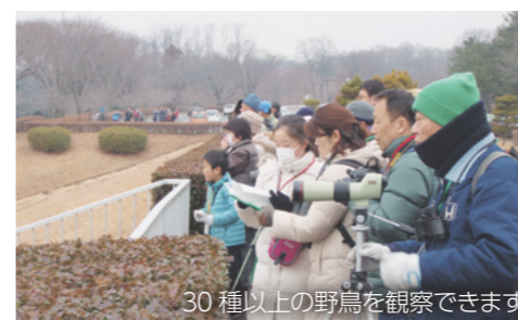
30種以上の野鳥を観察できます

嶺公園で野鳥観察会を開催。市内で見られる多様な野鳥の特徴など講師の説明を聞きながら嶺公園の自然を満喫しませんか。日時は2月19日(日)午前9時から正午まで、対象は一般、先着60人。筆記用具、雨具、双眼鏡（持っている人）を用意してください。申し込みは1月20日(金)から環境政策課へ。