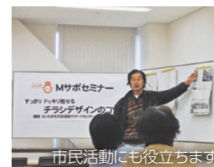
市民活動にも役立ちます

チラシセミナー「知らねばならない、チラシのコツ～知ると得するコト、知らぬと損するコト」を開催。イベント開催時などに作るチラシのコツを学びます。この講座は、まえばし地域活動ポイント制度の対象です。日時は2月11日(土)午後2時から5時まで、前橋プラザ元気21内市民活動支援センターで行います。市民活動をしている人や関心のある人、先着30人が対象です。申し込みは2月6日(月)までに同センターへ。