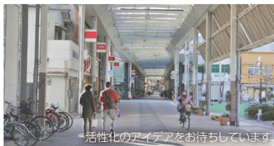
活性化のアイデアをお待ちしています

中心市街地活性化基本計画の素案についてパブリックコメント（意見募集）を実施。寄せられた意見は、本市の考え方と併せて各閲覧場所で公表します。