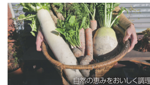
自然の恵みをおいしく調理

自然食材の調理などをとおして、生活や環境を考えるオーガニックカレッジを開催します。日時は2月23日から3月16日までの木曜4回、午後7時から9時までで、前橋プラザ元気21で行います。18歳から30歳まで、先着30人が対象。費用は2,000円です。2月16日(休)までに生涯学習課へ申し込んでください。