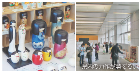
県内の力作が勢ぞろい

全群馬近代こけしコンクールを開催。創作・新型こけしや木地玩具などを展示するほか、こけしの絵付け体験・販売も行います。日時は2月2日(休)から6日(月)までの、午前9時から午後5時まで（6日は午後4時まで）、会場は県庁1階県民ホール（大手町一丁目）です。