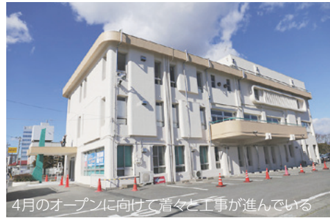
4月のオープンに向けて着々と工事が進んでいる