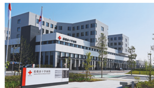
前橋赤十字病院(朝倉町389-1)

前橋赤十字病院の移転に伴い、6月4日(月)から、5路線のバスが新しい病院に乗り入れる予定です。前橋・駒形・前橋大島・大胡・高崎の各駅からアクセスできます。なお、各路線とも許認可申請中のため、時刻表など詳しくは各バス会社に問い合わせてください。