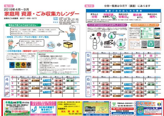
家庭用資源・ごみ収集カレンダー