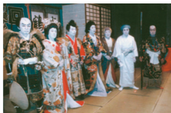
昭和50年に行われた横室歌舞伎