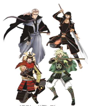
イラスト 井田ヒロト

4時 対象 県内在住の人、先着50人 申し込み 8月10日(金)～9月7日(金)に文化国際課へ ● 四公ご朱印めぐり 四公御廟所六(むつろ)寺社で「前橋四公ご朱印帳」を無料配布。期間内に、同六寺社のご朱印スタンプを集めると、先着100人に四公限定グッズを贈呈します。贈呈は10月7日(日)午前10時から前橋まつり内にこのパーキングで行います。