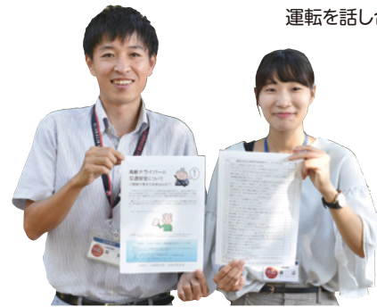
運転を話し合うきっかけとして活用してください。

高齢ドライバーが自身の運転適性を確認できるよう、安全運転啓発チラシ(チェックリスト)を作成しました。高齢ドライバーが交通事故の加害者にならないよう、運転について家族で考え、話し合うきっかけにしてください。チラシは市役所長寿包括ケア課・介護保険課や各支所・市民サービスセンター、地域包括支援センター、老人福祉センターで配布するほか、交番や駐在所などでも配布します。