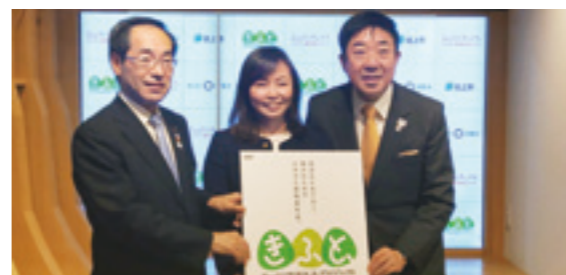
2月18日に連携協定を締結しました。

ふるさと納税思いやり型返礼品プロジェクト「きふと」を開始。本市と岩手県北上市、ふるさとチョイス運営会社のトラストバンクが連携し、思いやり型返礼品を全国に広めるプロジェクトを始めました。思いやり型返礼品とは、自分のためではなく誰かのためになる返礼品。寄付制度の本旨に添う、返礼品を選ぶことでできる社会貢献を全国の寄付者に提案します。