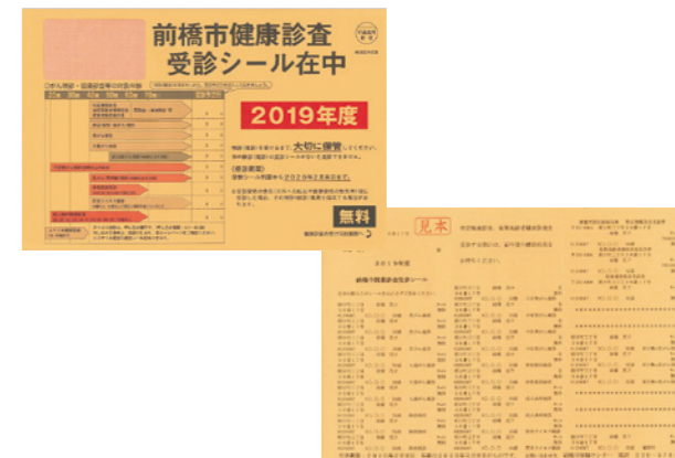
オレンジ色の封筒が届いたら確認を

☎受診シール・がん検診については健康増進課 ☎027-220-5784 ☎国保特定健康診査については保健指導室 ☎027-220-5715 ☎後期高齢者健康診査については国民健康保険課 ☎027-898-6253