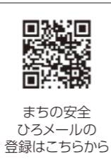
まちの安全ひろメールの登録はこちらから

本市ではそれをまちの安全ひろメールなどでお知らせします。避難勧告などの緊急情報を発令するときは、土砂崩れや河川氾濫などが今まさに発生する恐れのある危険な状況です。災害はいつ起きるか分かりません。早めの情報収集と行動が、命を守ることに繋がります。