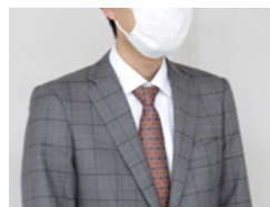
マスクを着用する