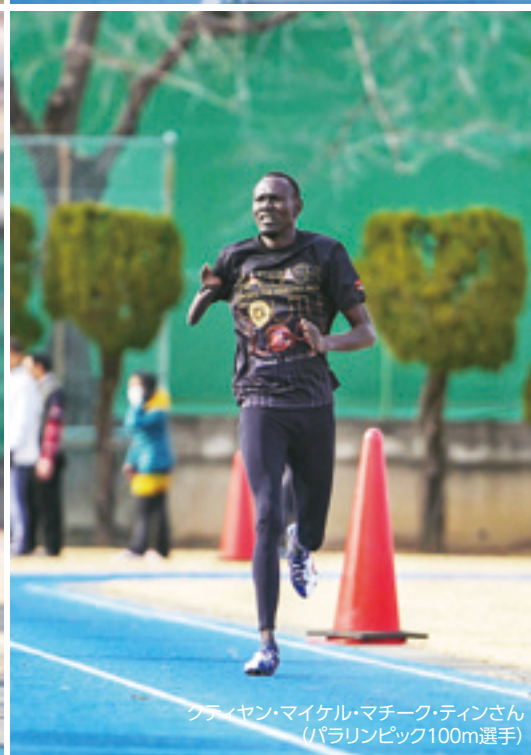
クティヤン・マイケル・マチーク・ティンさん (パラリンピック100m選手)