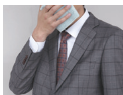
ティッシュやハンカチで口 と鼻を覆う