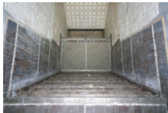
新しい焼却炉内部