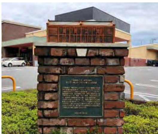
旧上毛倉庫記念碑