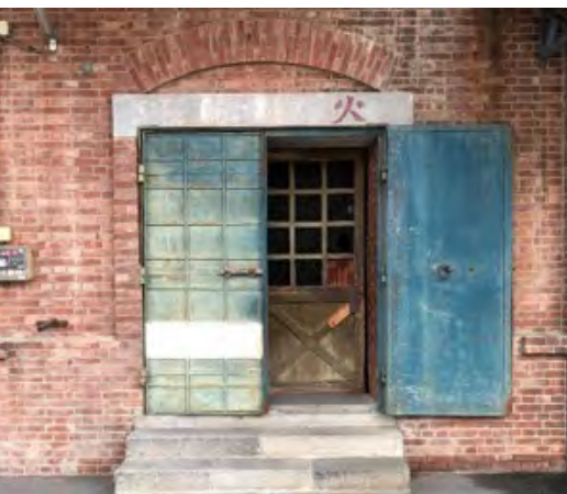
旧安田銀行担保倉庫