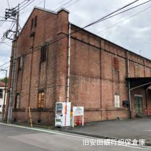
旧安田銀行担保倉庫