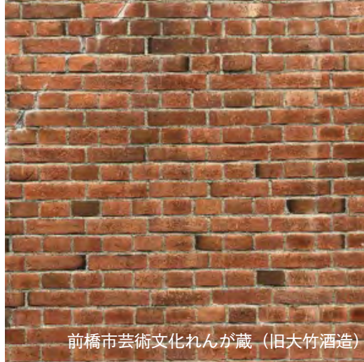
前橋市芸術文化れんが蔵（旧大竹酒造）