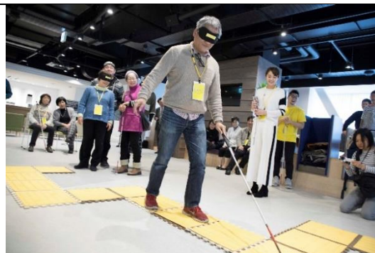
点字ブロックリレー