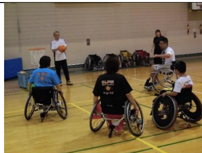
競技用車いす体験