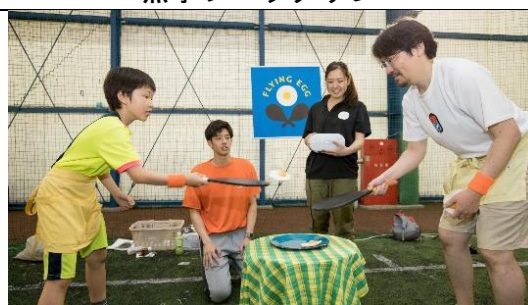
フライングエッグ