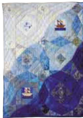
海の嵐 (パッチワーク)

ブルーが大好き。このタペストリーは波の形や色の組み合わせなどがうまく表現でき気に入っています。桂萱公民館のサークルに入って12年。次は大きな作品にトライしたいですね。