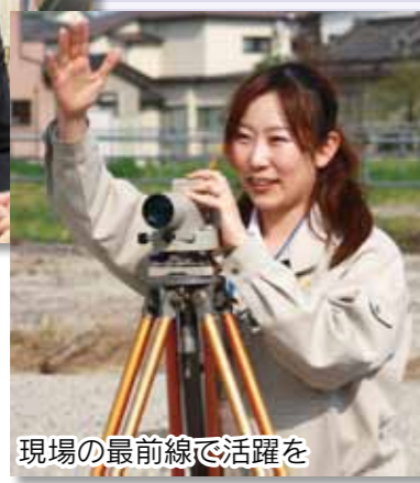
現場の最前線で活躍を