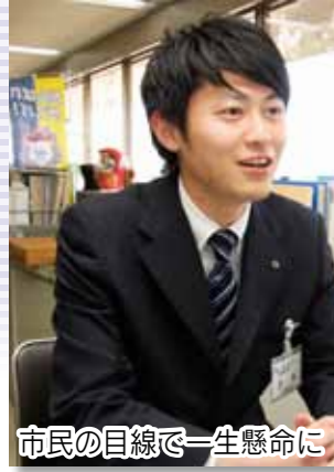
市民の目線で一生懸命に

来年4月1日付で採用予定の職員採用試験を行います。概要は下表のとおりです。試験案内は市役所職員課や各支所・市民サービスセンターにあります。また、申込書は本市ホームページからダウンロードもできます。郵送で請求する場合は、あて先を記入し140円切手を貼った返信用封筒(A4サイズ)を入れ、表面に「採用試験申込用紙請求」と「試験区分」を朱書した封筒を、市役所職員課へ。