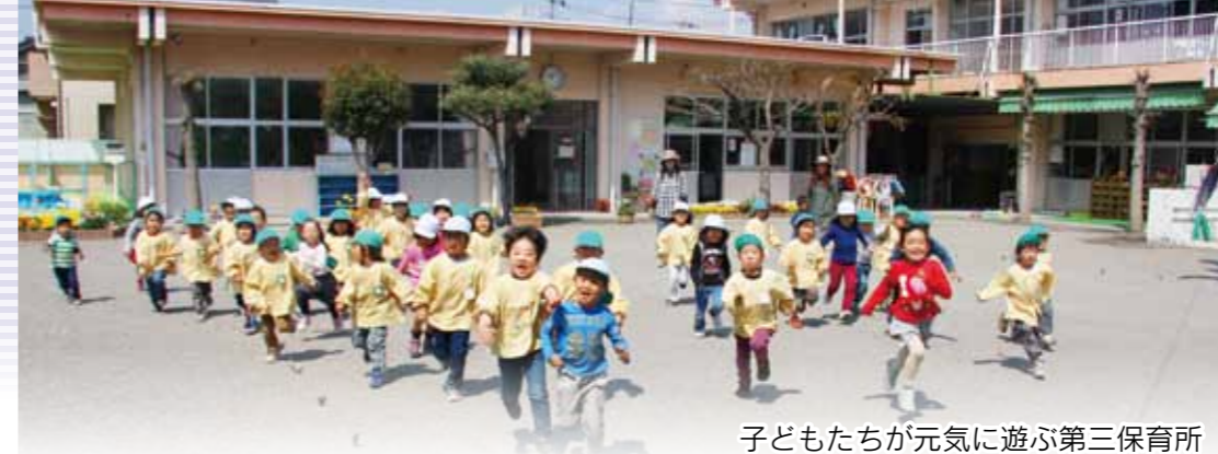
子どもたちが元気に遊ぶ第三保育所

「急な用事で保育できなくなった」、「少しの間、育児のことを忘れてリフレッシュしたい」。そんな人のために、子どもの預かりを行っている保育所(園)があります。暮らしに合わせて、上手に利用してください。