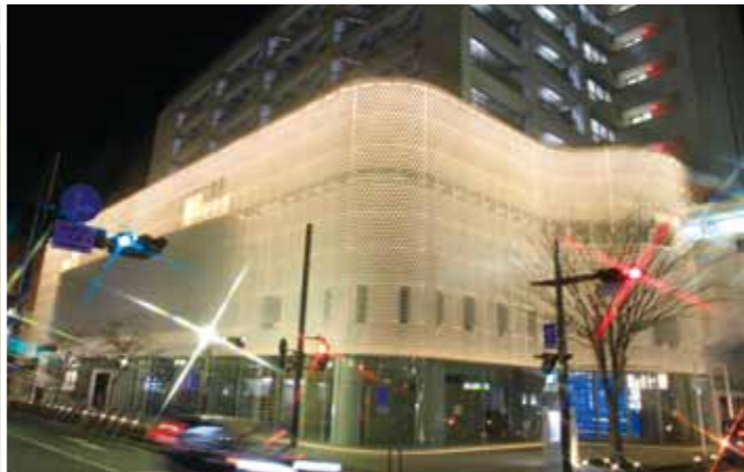
毎日午後5時から10時までライトアップを実施中です