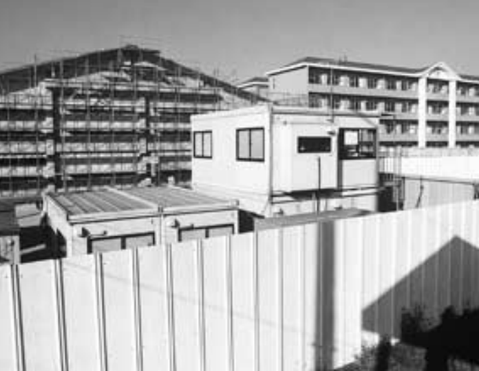
教育環境を整え六中体育館も新築

906542へ。 8 問い合わせは財政課 本年度の上半期（四月一日～九月三十日）の財政状況をまとめた「前橋市の財政」を公表します。厳しい財政状況の中、市民の生活や活動に真に生きる支出となるよう心掛けています。数字は九月三十日現在で、金額の一万円未満は整理してあります。