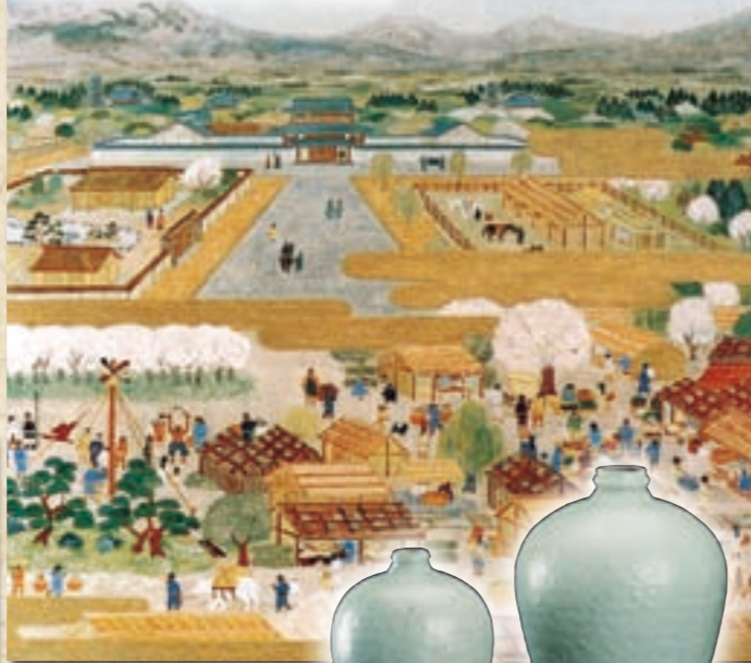
上野国府周辺の市の様子(想像図)