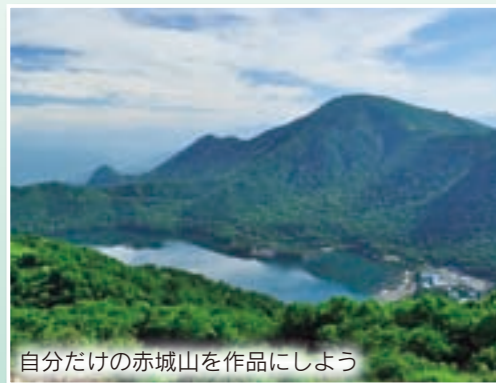
自分だけの赤城山を作品にしよう