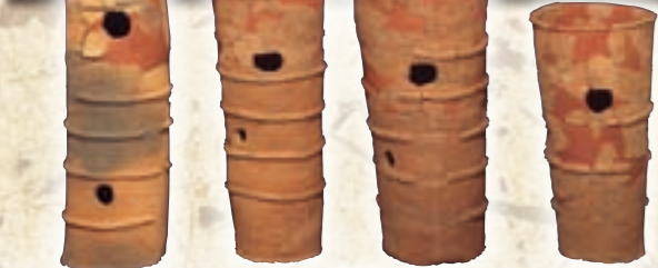
井手二子山古墳の朝顔型埴輪と円筒埴輪