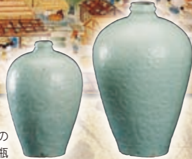
元総社蒼海遺跡群の 青白磁梅瓶

本市と高崎市が連携して、東国千年の都「発掘されたタ・カ・ラ・モ・ノ～新発見！前橋・高崎の歴史」と題して文化財展を開催。両市における近年の遺跡発掘調査などの成果を紹介します。この機会に文化財に触れてみませんか。