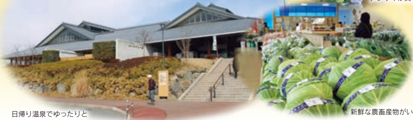
新鮮な農畜産物がいっぱい