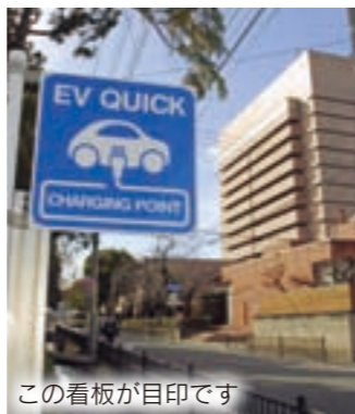
この看板が目印です