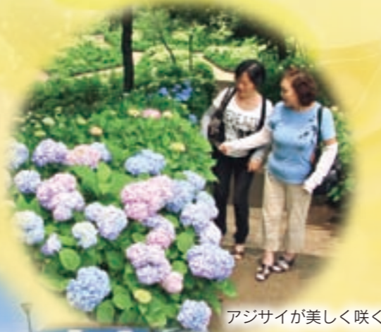
アジサイが美しく咲く