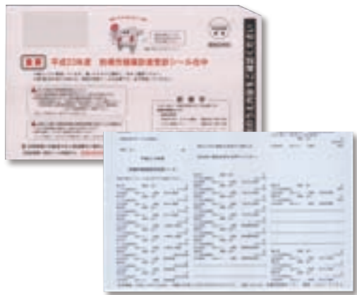
本年度は水色のシールです