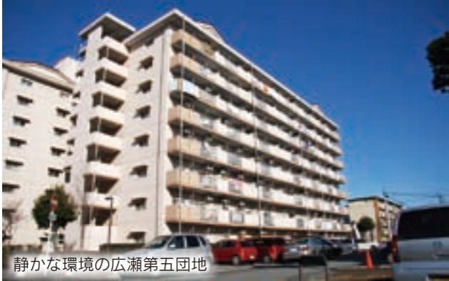
静かな環境の広瀬第五団地