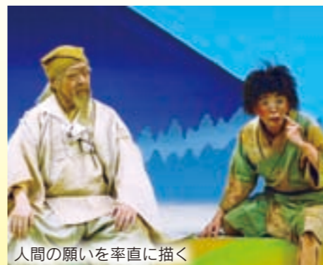
人間の願いを率直に描く

市民文化会館の再オープンを記念して「泥かぶら」の公演を行います。昭和27年の初演以来、半世紀以上、上演され続ける泥かぶら。今も多くの人々に生きる喜びを語りかけるこの公演に市民の皆さんを招待します。