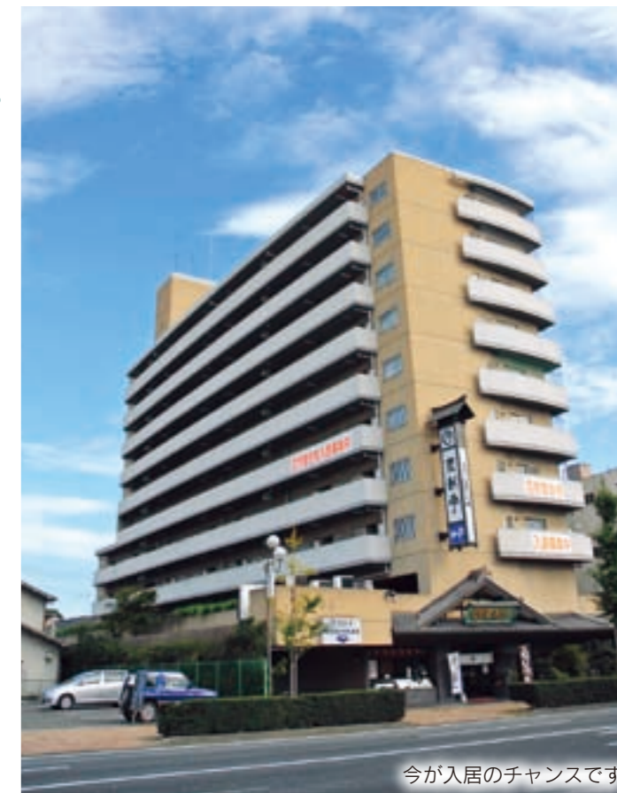
今が入居のチャンスです

不動産を所有せず基準月収額が15万8,000円以上48万7,000円以下で2人以上の世帯など。詳しくは問い合