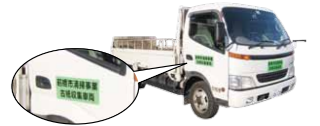
緑色のステッカーが古紙分別収集車の目印です

10 月から開始した古紙分別収集の成果をお知らせします。収集した古紙の 1 カ月の総重量は、前年に比べ 20% 増の約 1,132t。減少傾向にあった地域の廃品回収も 5% 増加しています。これによって約 650 万円の焼却処分費用を節約できました。皆様のご協力に感謝します。これからも積極的な古紙分別をお願いします。