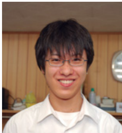
暗算検定十段に合格