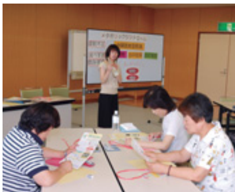
メタボの予防に正しい知識を