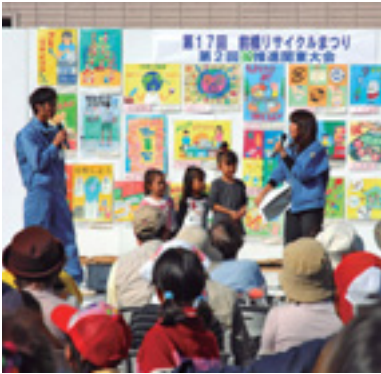
「回れ回れリサイクル社会」をテーマにしたリサイクルポスターの表彰も

1マに、第18回前橋リサイクルまつりを開催します。ご家族でお出掛けください。 日時 10月19日(日)午前10時～午後3時 会場 六供清掃工場 内容 フリーマーケットやリサイクル品抽選会、清掃工場見学会など 〇：問い合わせは清掃業務課☎898-6273へ。