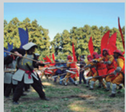
激しい攻防戦を再現