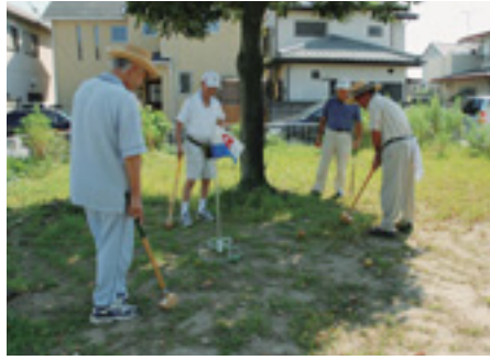
運動会に向けて 和やかに練習

9月12日、天川原町二丁目のバラ公園で、グラウンドゴルフが行われました。健康のため毎週金曜に行い、2年以上続けています。この日は地区運動会の練習も兼ね10人が参加し、青空の下で楽しくゲーム。ひと汗流した後のお茶会では、互いのプレーを振り返りながら、おしゃべりに花を咲かせました。