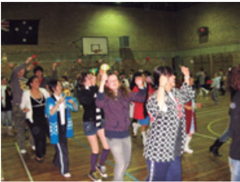
交流の様子を紹介します