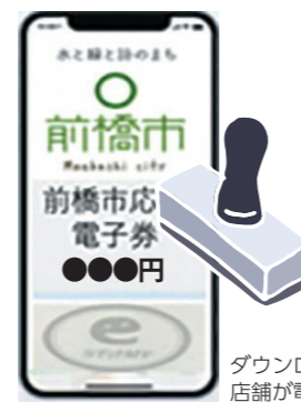
ダウンロードした電子チケットに店舗が電子スタンプを押印