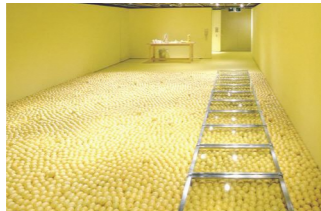
《レモンプロジェクト03》1997年 作家蔵 撮影：Tadahisa Sakurai ©Satoshi Hirose