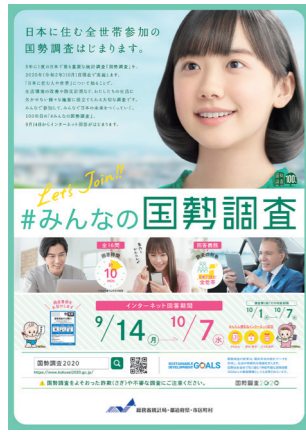
国勢調査の開始から今年で100年を迎えました。

査では市民の47.3%がインターネットで回答。引き続き、オンライン上で簡単にできるインターネット回答への協力をお願いします。