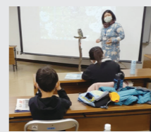
公民館フクロウ講座