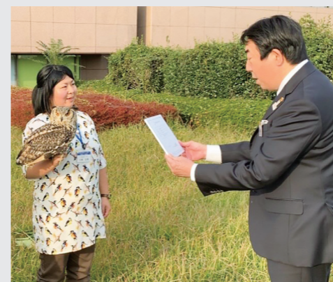
フクロウ特別住民票交付式