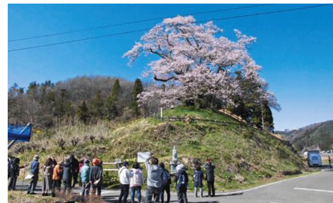
発知のヒガンザクラ