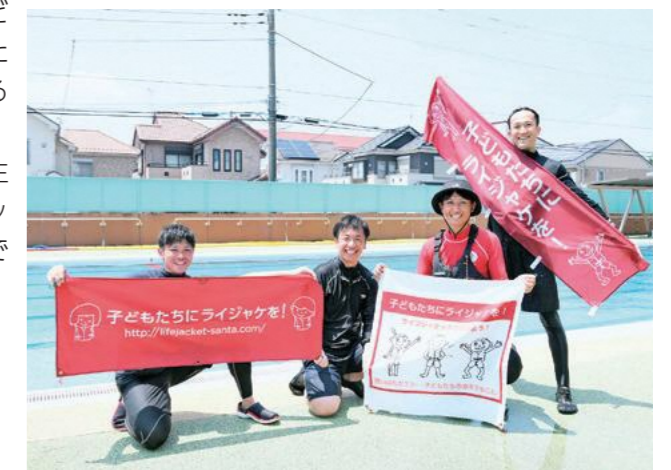
市水難事故予防自主研究グループ職員