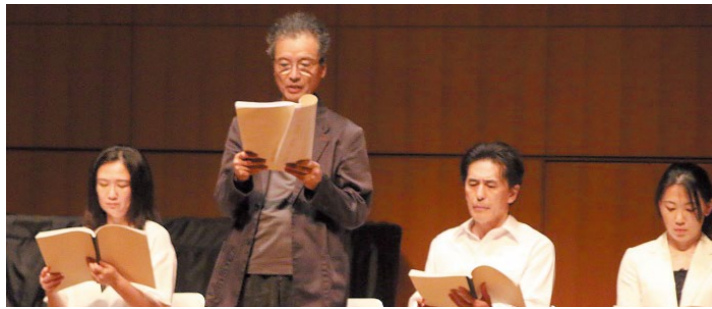
リーディングシアター Vol.2「イェスタディ」より