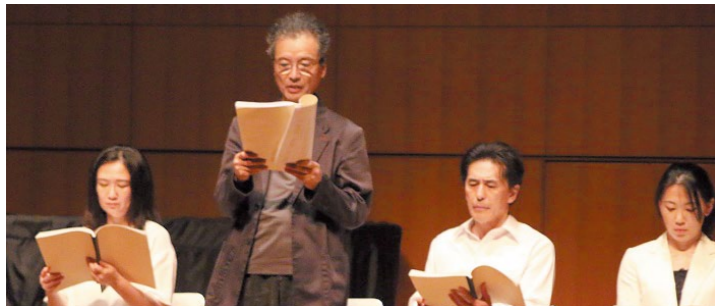
リーディングシアター Vol.2 「イェスタディ」より