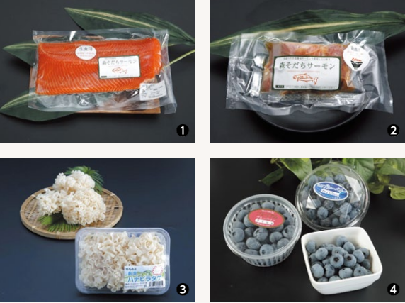
①森ぞだちサーモン 1尾2,700円/kg、皮なし半身6,750円/kg ②森ぞだちサーモン醤油漬 1パック1,080円 ③はおおさき ☎027-283-4325 ④寿幸ハナピラタケ 1パック194円 ⑤ふらわーきのこ園 ☎027-283-4777 ⑥ブルーベリー 完熟品400円、プレミアム品500円 ⑦前橋ブルーベリー生産組合 ☎080-5686-9128

本市の優れた産品で、地産地消の推進と食の安全・安心の確保に取り組んでいる物を認証する「赤城の恵ブランド」。新たに4品目が認証されました。