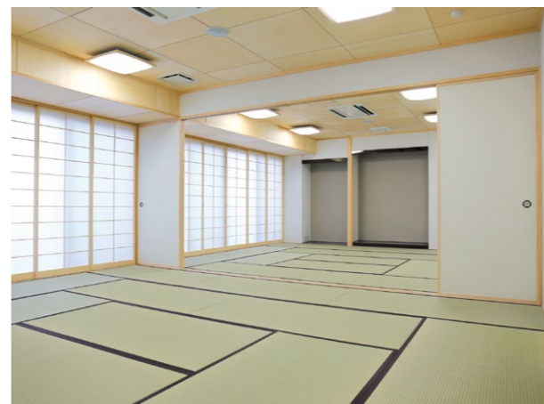
1階には和室 (15畳) が2部屋