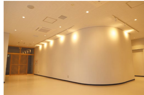
壁面展示ができる1階ロビー

第一コミセンは桃井小に併設。15畳の和室2部屋と100人が収容できるホール1部屋の計3部屋が利用できます。利用するには、前橋プラザ元気21内中央公民館窓口での利用団体登録と予約が必要です。利用団体登録は2月19日(月)から、利用予約は3月1日(水)午前