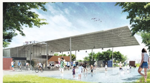
道の駅イメージパース