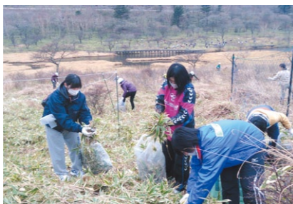
市民活動で前橋の環境を守っていく

市内の団体や自治会が市民を対象に実施する、地域での自然観察会や小学生向けの環境保全活動などに補助金を交付します。