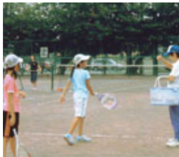
優しい指導ですぐに上達