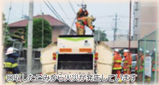
回収したごみから火災が発生しています

昨年4月からこれまでに、ごみ収集車の火災事故が5件発生しています。これらはスプレー缶などに残っていた可燃性ガスに引火したことが原因です。幸いにも大きな被害はありませんでしたが、一つ間違えると重大事故につながる恐れがあります。このような火災を防ぐためにも、スプレー缶やカセットボンベ、ライターなどは、次の点に注意し不燃ごみには絶対に出さないでください。