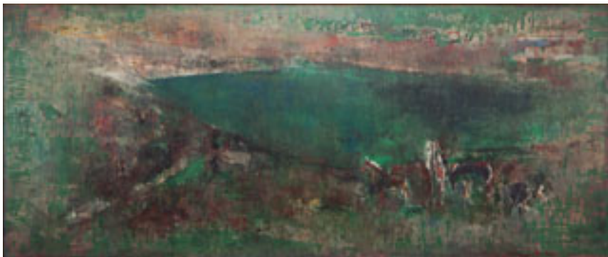
山口薫 『沼のある牧場』 昭和39年 油彩・カンバス（105・6センチ×255・5センチ）

市役所の庁議室に、群馬を代表する画家、山口薫さん（明治40年―昭和43年）の作品が掛けられています。横長の画面中央に、菱形の沼が大きく配され、その