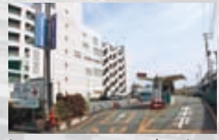
旧イトヨーカドー南にある前橋駅北口駐車場