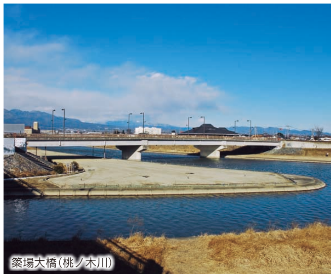
築場大橋(桃ノ木川)