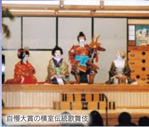
自慢大賞の横室伝統歌舞伎

「誇り」をテーマに募集した一地区一自慢。本年度は各自治会から81件の地区自慢が集まりました。厳正な審査の結果、自慢大賞、自慢賞、審査員特別賞が右表のとおり決定。