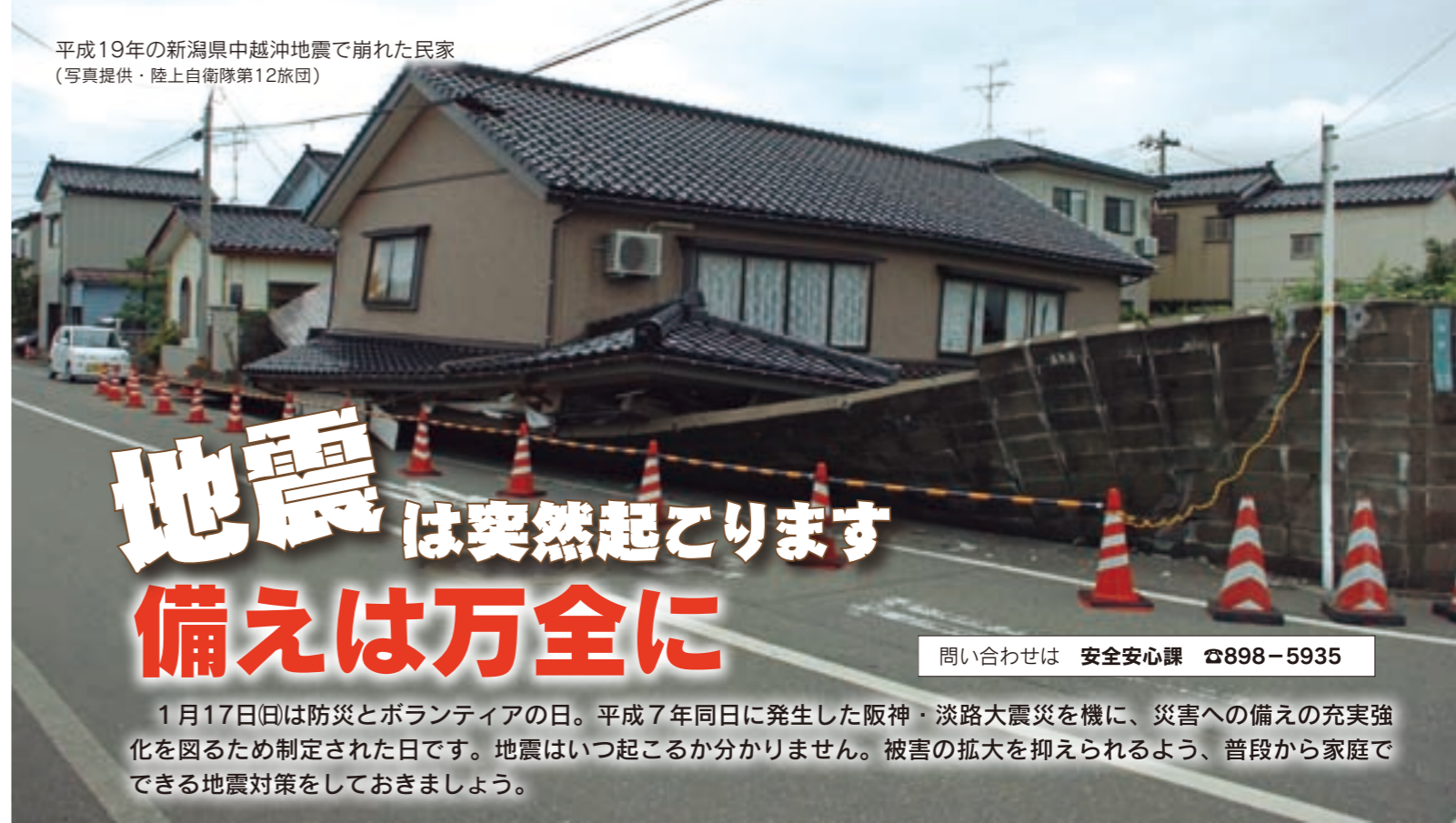
平成19年の新潟県中越沖地震で崩れた民家