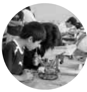
相談コーナーを開設

まえばしロボコン2006を開催します。 今回のテーマは「ロボコンサッカー!」シミュートを決めろ!!」です。競技フィールドに置かれているスポンジボールを相手ゴールに入れ、その得点を競い合う競技で、部門は中学生と一般の二つ。個人または五人以内のチームで申し込んでください。なお、大会