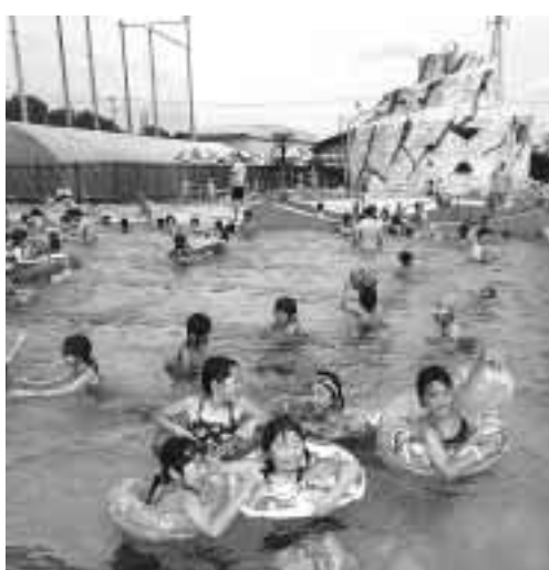
元気に楽しく泳ぎましょう

前には相談コーナーも定期的に開設しますので、初めてロボットを作る人も安心して参加できます。 日時 8月19日(土)午前10時 会場 県生涯学習センター(文京町二丁目) 対象 個人または五人以内のチーム 申し込み 7月15日(土)までにハガキまたはホームページで。ハガキの場合は参加部門・チーム名(十字以内)・代表者の住所・氏名・電話番号・チーム構成(友人、親子など)・人数・学校名(中学生部門のみ)を明記し、市役所文化政策課(890-6522)へ。ホームページのアドレスは http://www.maebashi-roboccon.net/