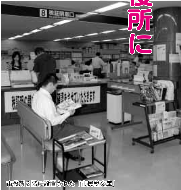
市役所2階に設置された「市民税文庫」

政について語り合いませんか。 日時①7月31日(月)②8月31日(木)③9月29日(金)、正午～午後1時 会場 市役所12階市民ロビー 対象 市内在住・在勤・在学で小学生以上の五十人の団体・グループ(小学生は保護者が引率)、各一組(抽選) 内容 昼食を取りながら市政への提案や課題などを市長と対談 参加費 一人五百円(昼食代) 申し込み 7月10日(必着)までにハガキで。希望日・団体名・参加人数・団体のプロフィール・代表者の住所・氏名・電話番号・市長と話したいテーマを明記し、市役所秘書課(内線3403)へ。