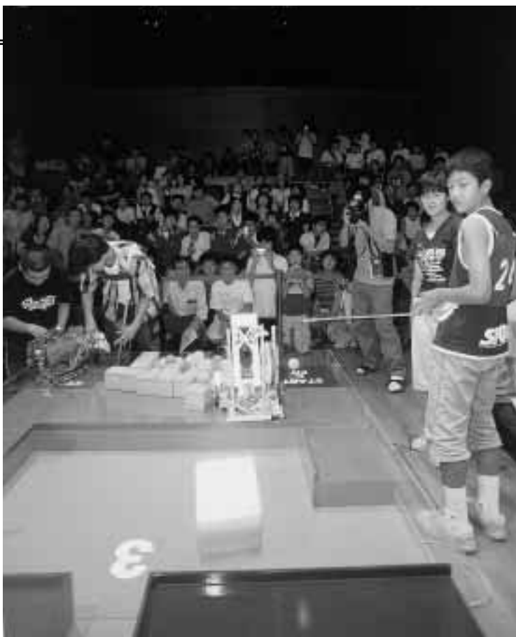
箱を飛ばして移動させるなど工夫されたロボットが

まえばしロボコン2006を開催します。 今回のテーマは「ロボコンサッカー!」シミュートを決めろ!!」です。競技フィールドに置かれているスポンジボールを相手ゴールに入れ、その得点を競い合う競技で、部門は中学生と一般の二つ。個人または五人以内のチームで申し込んでください。なお、大会