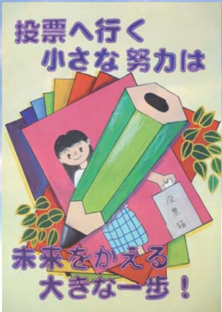
全国明るい選挙啓発ポスターコンクール 「明るい選挙推進協会会長・都道府県選挙管理委員会連合会会長賞」作品

問い合わせは 選挙管理委員会事務局 入場券については 市民課 ☎898-6742 ☎898-6102