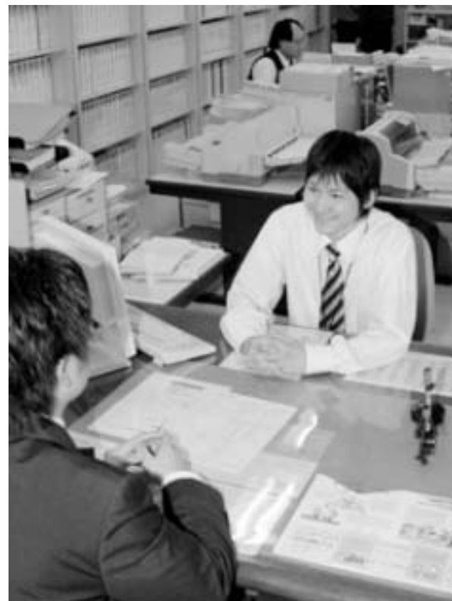
窓口で職員が丁寧に説明します