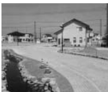
家が建ち並ぶ住宅団地

引っ越しをするときには次の五点を確認し、電話で早めに水道局へ届け出てください。 届け出がないと、実際には水道局へ届け出ていくと、基本料金が掛かってしまいます。なお、届け出は水道局だけでなく、市役所二階水道局窓口、大胡・宮城・粕川支所、または水道局・県のホームページでも受け付けています。 現住所（水道使用場所） 使用者の氏名、「水道使用量等のお知らせ」や領収書に記載されている「水道番号」、引っ越し日 引っ越し先の住所と電話番号 …問い合わせはジーシー自治体サービス前橋センター 890 3300へ。 問い合わせ先名称が変更 四月から水道の使用開始や料金などの問い合わせ窓口の名称がジーシー自治体サービス前橋センターから「水道局お客様センター」となります。なお、業務の委託先や電話番号は変更ありません。 …問い合わせは水道業務課 890 3051へ。